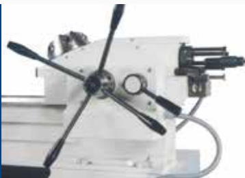
Handrevolver mit automatischem Vorschubantrieb (Option)