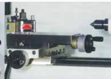
Kurbelkreuzsupport mit schwenkbarem Ober-schlitten; \pm 40^\circ Schwenkbereich