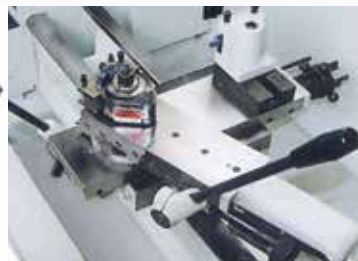
Werkzeugschlitten aus Grauguss mit geschabter Bettschlittenführung; Schmierung der Führungsbahnen erfolgt über Nippelschmierung